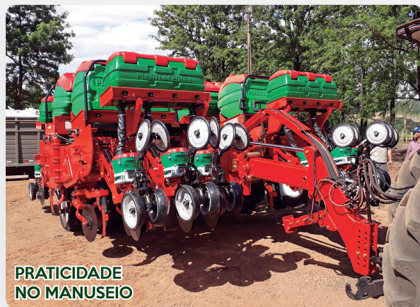
PRATICIDADE NO MANUSEIO