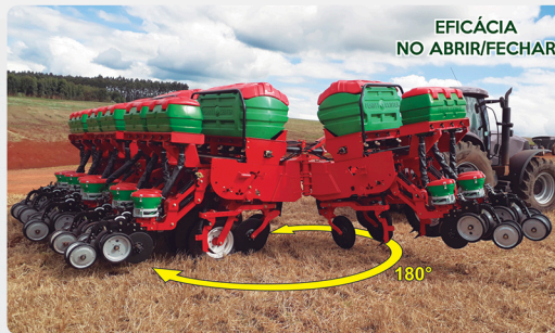
EFICÁCIA NO ABRIR/FECHAR