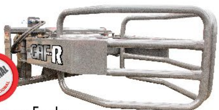
Garfo para Fardo Round Blade Clamp / Grapa para Paca Redonda