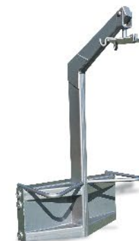
Guincho Hoist / Grua