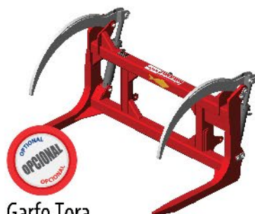
Garfo Tora Log and Lumber Fork / Horquilla para Madera e Troncos