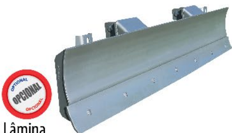
Lâmina Front Loader / Pala