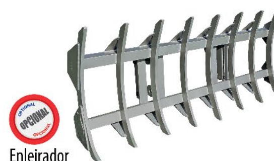
Enleirador Fork / Rastrillo